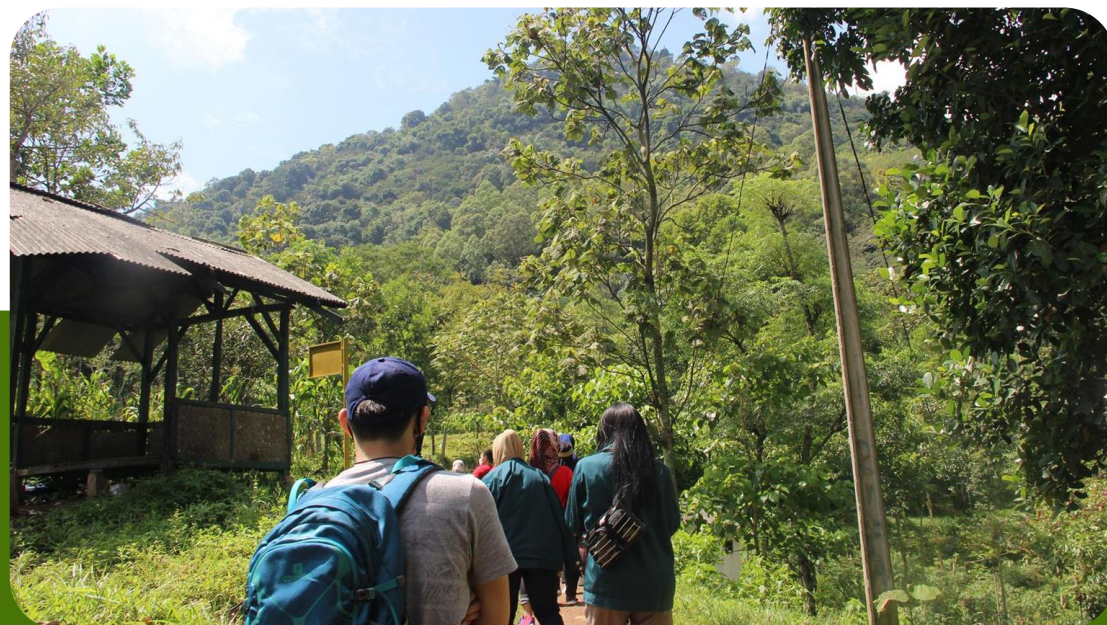
Kawasan Hutan Dengan Tujuan Khusus (KHDTK) Hutan

Pendidikan Gunung Geulis, Kabupaten Sumedang