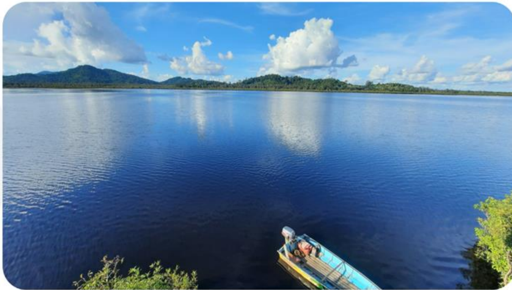
Sungai Pelaik, Desa Melemba, Kapuas Hulu, Kalimantan Barat (Wiwit Astari, 2022)