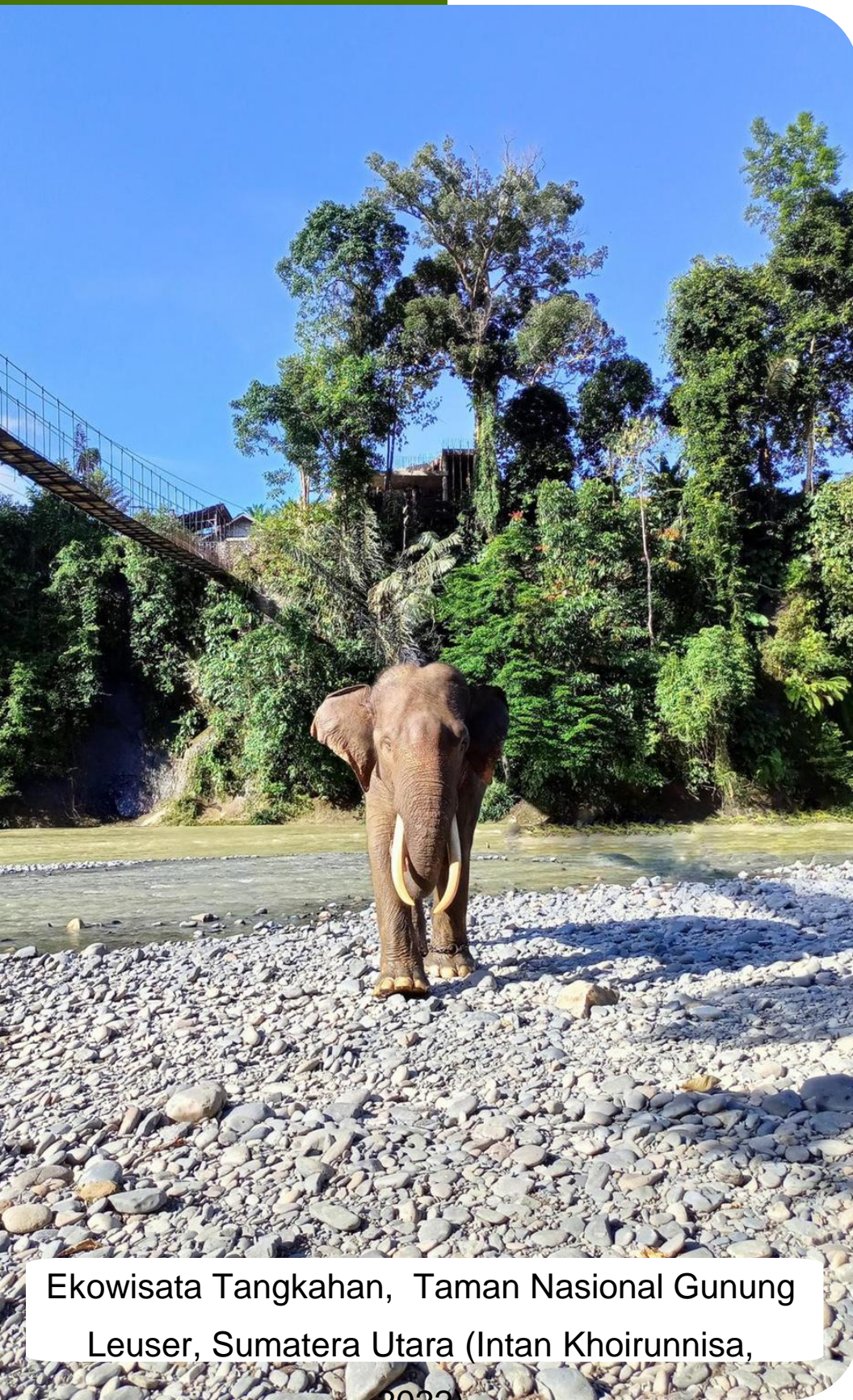
Ekowisata Tangkahan, Taman Nasional Gunung Leuser, Sumatera Utara (Intan Khoirunnisa, 2022)