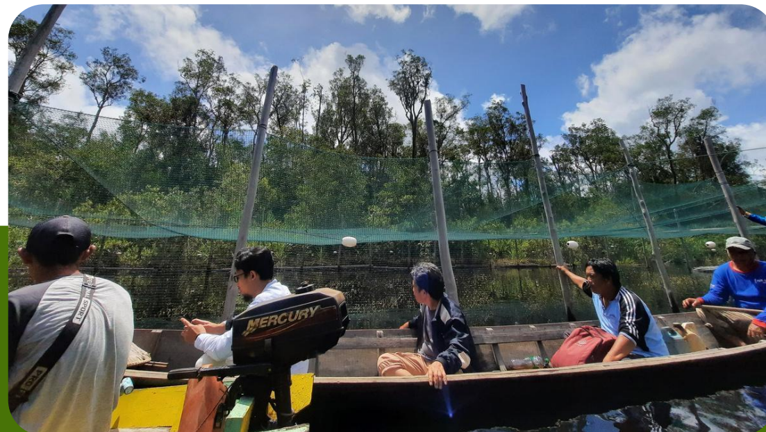
Sungai Pelaik, Desa Melemba, Kapuas Hulu,

Pendidikan Gunung Geulis, Kabupaten Sumedang