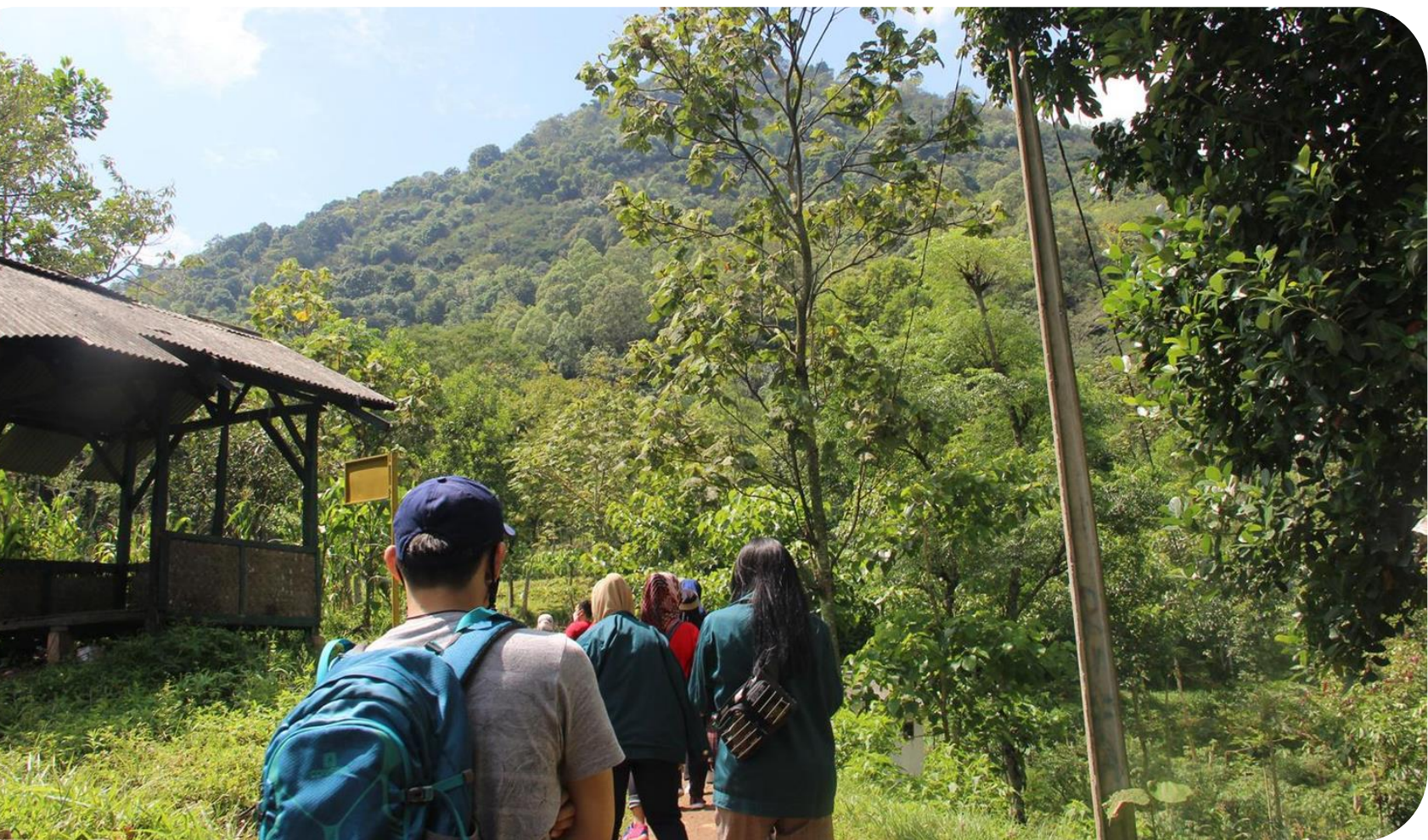
Kawasan Hutan Dengan Tujuan Khusus (KHDTK) Hutan Pendidikan Gunung Geulis Kabupaten Sumedang, Jawa Barat